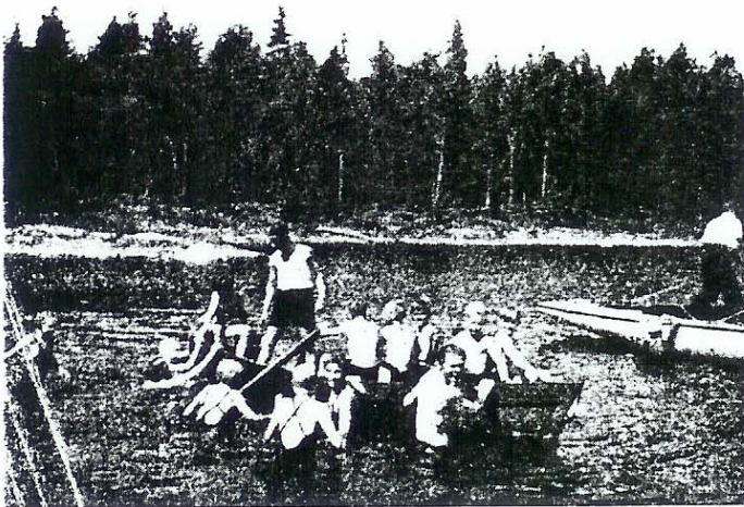
Här är unga, friska viljor . . .

stort ögonblick, när vi reste den lövade majstången — för första gången på egen mark. Och när vi då fattade varandras händer och bildade ring runt stången, innebar detta inte blott ett led i gammal god tradition, det var också ett löfte och en försäkran gentemot varandra att allt framgent hålla samman och ärligt kämpa för de ideal, som gillet ställt för sin verksamhet. När sedan i den ljusa sommarnatten den uppgående solen hälsades med låtar till fiol och klarinett, med sång och diktläsning, då förnummo vi var och en, att vi härute vid Stenuddens strand upplevat ett av de rikaste ögonblick livet har att skänka en ung människa.