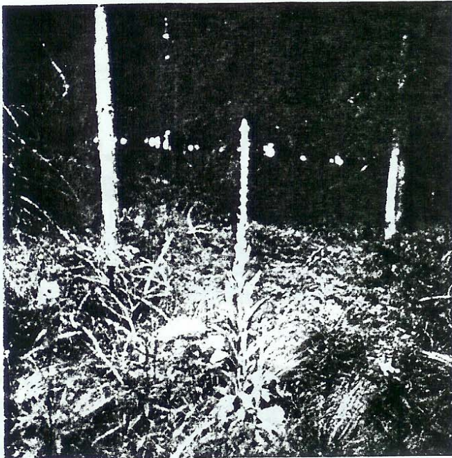
I solgläntan reser kungsljuset ( Verbascum thapsus ) sin stralande fackla

sig alldeles förträffligt där den ligger. Stilen är ovanligt tilltalande och linjerna rena och behagliga.