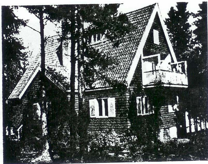
Inbäddad i grönskan från förnämt högstammiga granar och tallar ligger gillesgården Stenudden