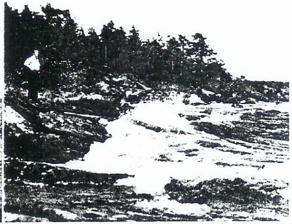
Nu danar bränningen mot strandklipporna