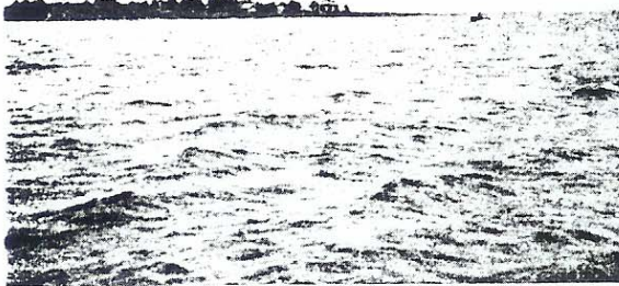
På andra sidan sundet häller fyren trogen vaktjänst